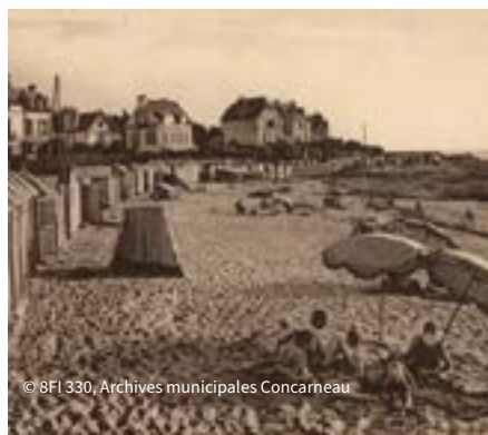
© 8FI 330, Archives municipales Concarneau

Êtes-vous prêts à embarquer pour la plus petite croisière du monde ? En famille, venez découvrir l'exposition De rives en rives, l'histoire capturée du bac du Passage . Vous pourrez ensuite construire la maquette du mythique bac Le Gouverneur, élément indissociable de l'histoire de la Ville.